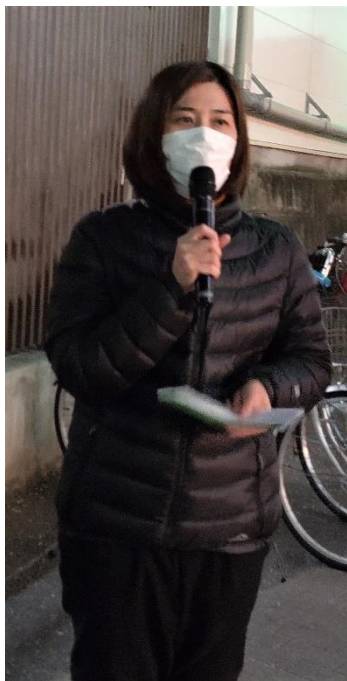
みずま雪絵プロフィール 1984 年 お花茶屋生まれ 区立上千葉小・青葉中 卒業 介護福祉士 区内の老人保健 施設・訪問介護で 10 年勤務 2013 年～葛飾区議会議員

【第 8 期葛飾区高齢者保健福祉計画・介護保険事業計画(素案)】が、保健福祉委員会で庶務報告されました。2021 年度～2023 年度の計画です。